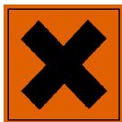
Xn - Nocivo