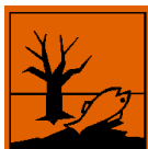
N - Pericoloso per l'ambiente